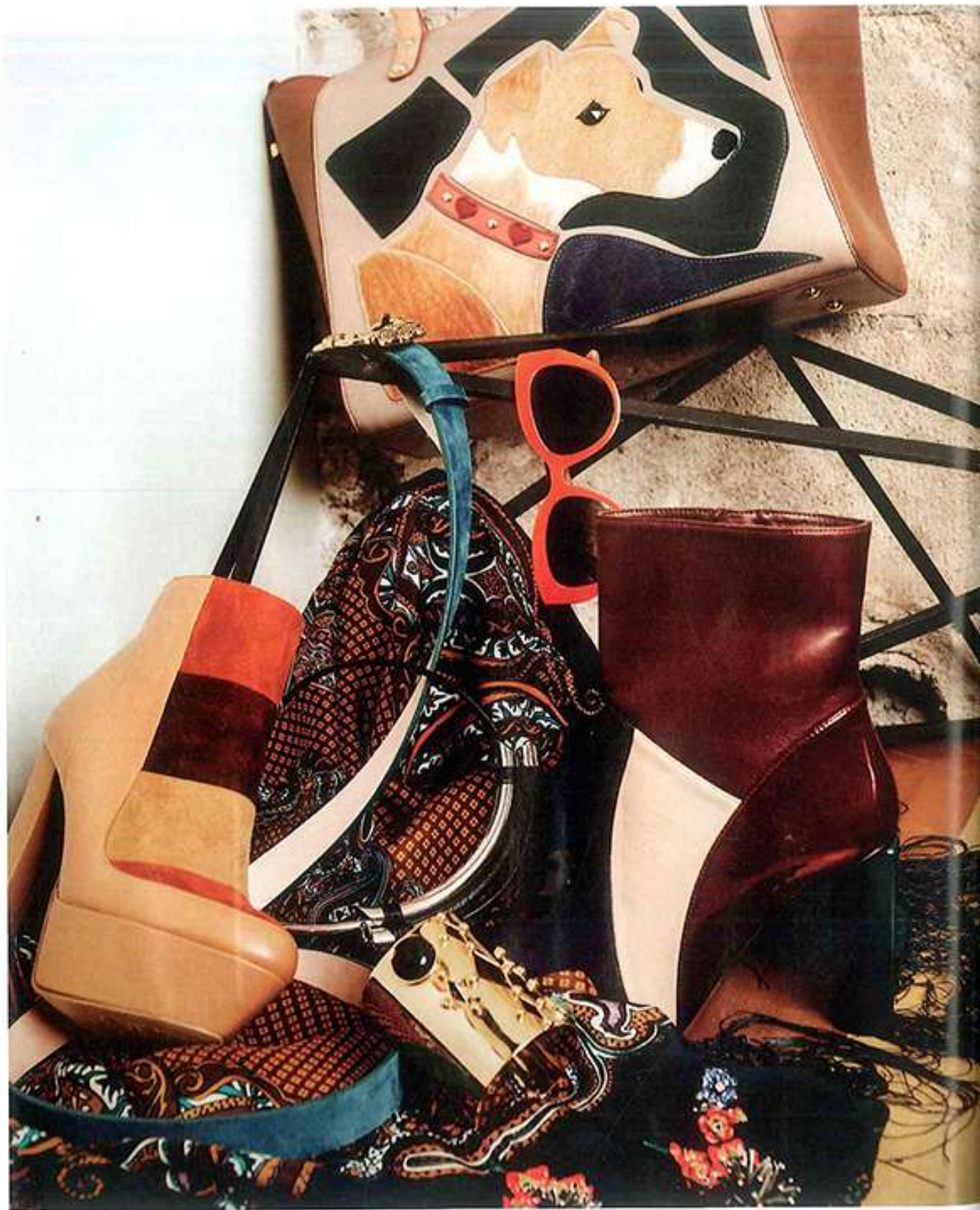
Bolsa edición limitada Dione, $4,295. Cinturón Uterqüe, $1,390. Lentes Dolce & Gabbana, $14,400. Botín plataforma Brantano, $1,199. Collar Adolfo Domínguez*. Botín bloques Dione, $1,995. Brazaletes Jill Hopkins, $1,298. Aretes Bimba y Lola, $3,200. Mascada Uterqüe, $1,890.