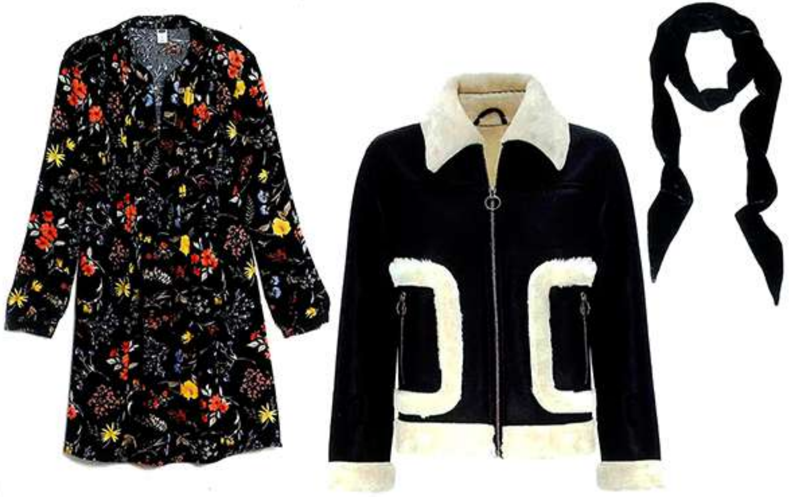
Vestido, Old Navy $776. Chaqueta, Mango $1,499. Bufanda, H&M $199. Sombrero, Zara $599. Perfume My Burberry Black, Burberry $1,800. Botín, Dolce Vita $2,500. Lip Gloss, Laura Mercier $430. Lentes, Prada $5,800. Bolsa, Dione $2,000.